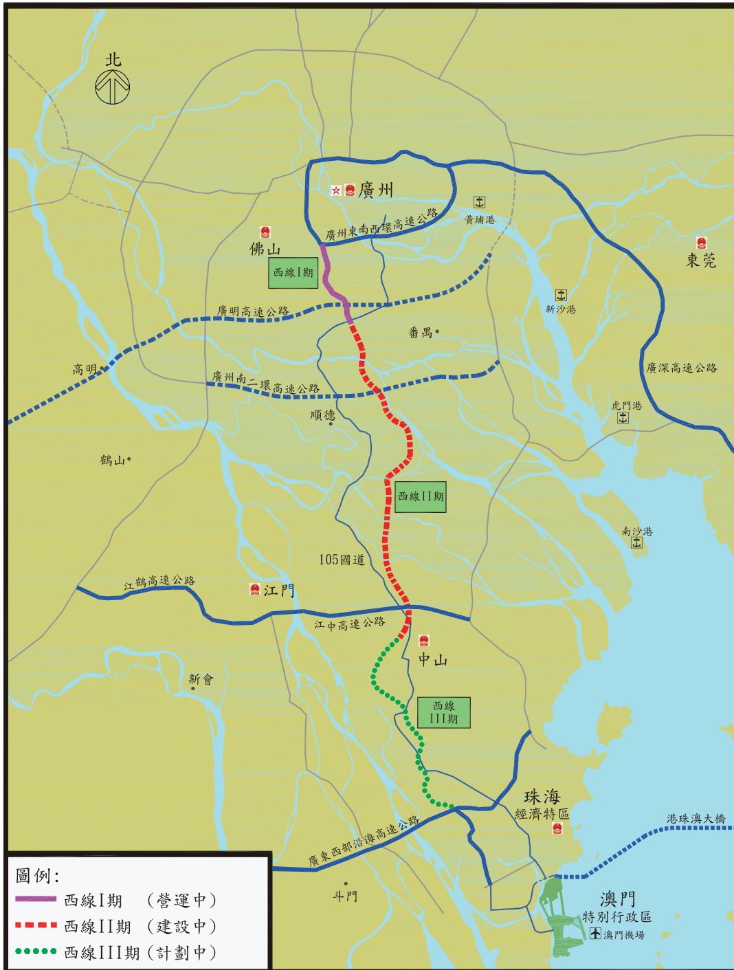
現設計下之珠江三角洲西岸幹道路線圖

下圖顯示在現有發展計劃下之珠江三角洲西岸幹道（由西綫I期、西綫II期及西綫III期組成）：